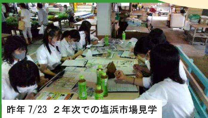
昨年 7/23 2年次での塩浜市場見学

塩浜市場の魅力アップを目的に、足りないもの・あったらいいなと思うものを自分たちで考え、作成します。