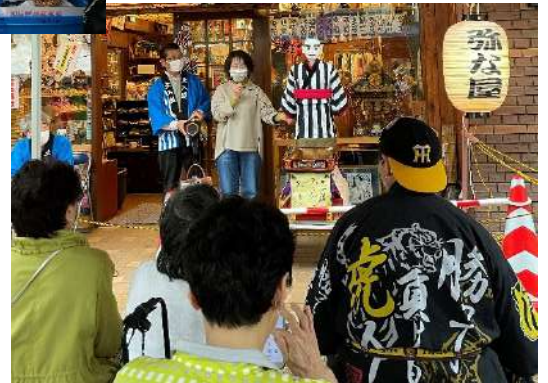
初披露のミニ入道(大入道の5分の1)