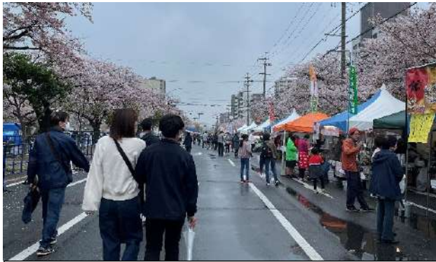
テイクアウトのみでも、賑わう三滝通り

検温ブースを複数設け、リストバンドによる確認など「三重県指針」に準じた感染防止策を講じ、2年ぶりの開催となりました。コロナ禍の下、積極的な活動が行われました。