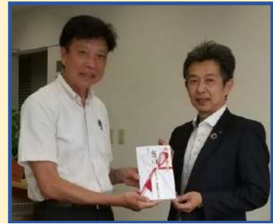
5月、日本たばこ産業(株)様他よりさきめし支援金を頂戴しました