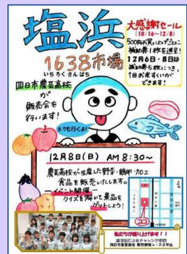
農芸10) 生徒の作成したチラシをデータ化し、A2ポスターとA4チラシを作成。チラシは中日三重サービスセンターへ持込み、配布を依頼