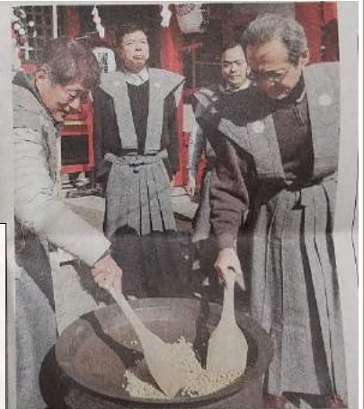
節分の豆をいる四日市商店連合会の会員たち＝四日市市海山道町の海山道神社で