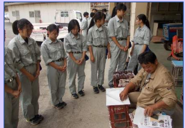
農芸6,7,8) 制作作業時に講師を依頼・派遣