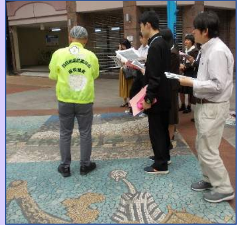
洒商4) 商店街視察時に講師を依頼・派遣